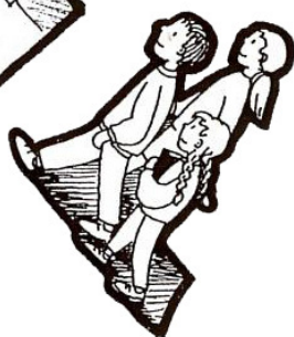
LE JEU DE L'OIE DE L'ANNÉE LITURGIQUE