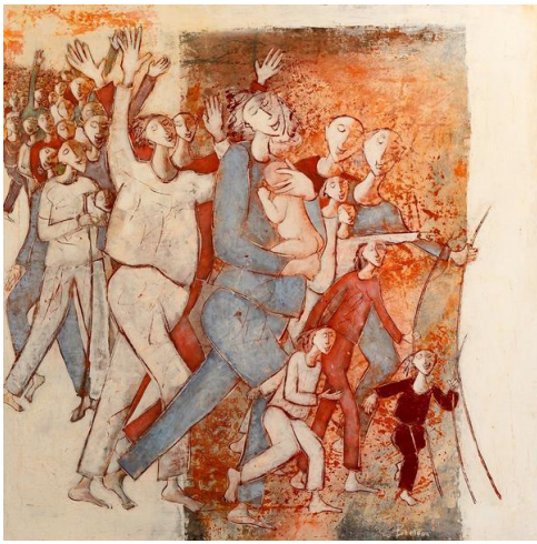
Prière du synode