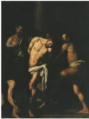
La flagellation du Christ